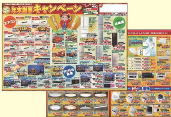
年末謝恩キャンペーンB3チラシ

👉 豊富な販促チラシ・販促ツールはお店が自店の形態、方針に合わせ自由にチョイスします ♪年末謝恩キャンペーンチラシ・PRポスター・のぼり♪ ♪LED照明祭りチラシ・のぼり♪