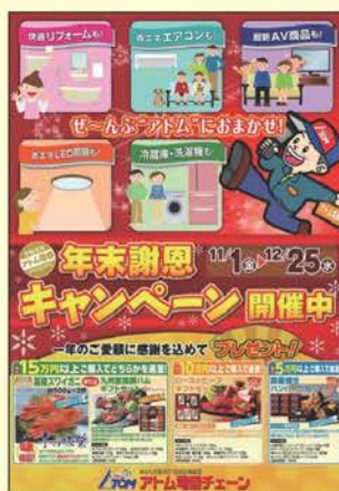
年末謝恩キャンペーンB2ポスター・のぼり