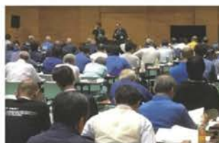
蓄電池提案セミナー 事例発表(中面でご案内)