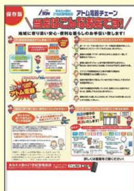
新規客づくり応援ツール