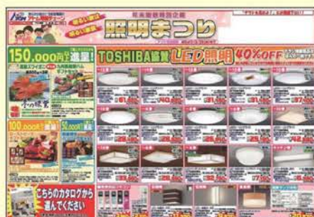
LED照明まつりB4チラシ・のぼり