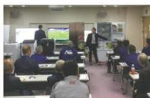
AloTつながる家電提案研修会 ほか新製品商品研修会