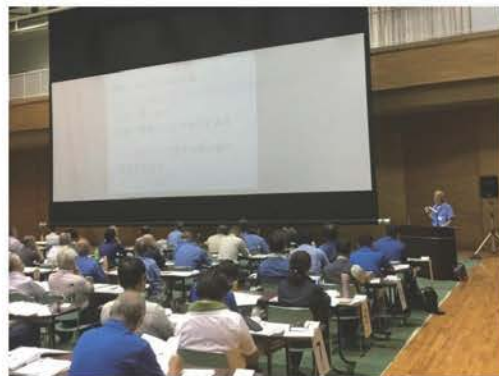
著者豊岡南店 大植様のご挨拶