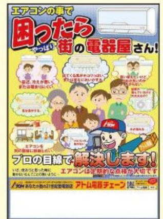
エアコンの困ったお任せ下さいチラシ