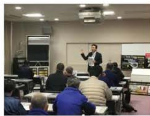
新製品研修会・工具展示会