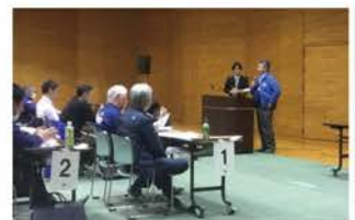
リフォーム取り組み 事例発表