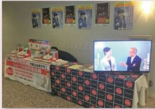
詐欺注意喚起ポスター、詐欺対策機能搭載電話機のデモ

昨今被害が急増している特殊詐欺に関して大阪府警察から詐欺の被害者となりやすい比較的高齢のお客様と接触する機会が多い町の電器店に対して撲滅活動への協力要請をいただきました。具体的には電話による特殊詐欺の被害防止に向け、電器店が詐欺対策機能のついた電話機の普及促進をすることでその被害を少しでも減らすことにつなげてほしいというものです。地域に根差して活動をする私たちがその商売を通じてお役に立てるといことは大変喜ばしいことと思っております。