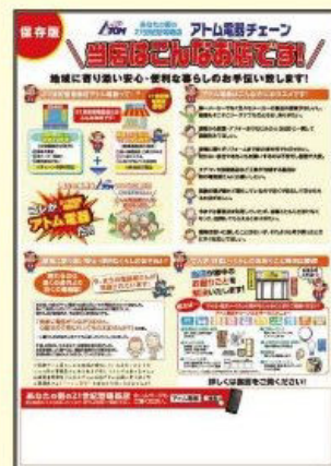
新規開拓用“当店はこんなお店です!”チラシ