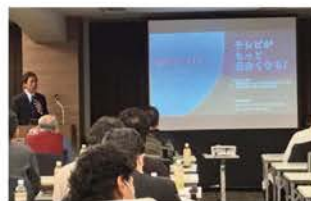
業界動向、販売のヒント満載 「テレビがもっと面白くなる」講演会