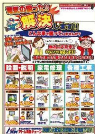
新規開拓用“お困り事解決します!”チラシ