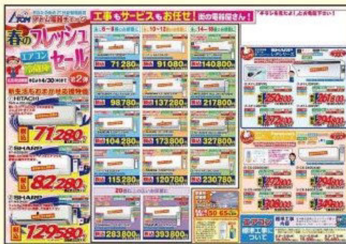
エアコン・冷蔵庫買替応援キャンペーンチラシ

豊富な販促チラシ・販促ツールはお店が自店の形態、方針に合わせ自由にチョイスします ♪エアコン・冷蔵庫買替応援キャンペーン♪、♪新規開拓用各種困ったチラシ、当店はこんなお店ですチラシ♪