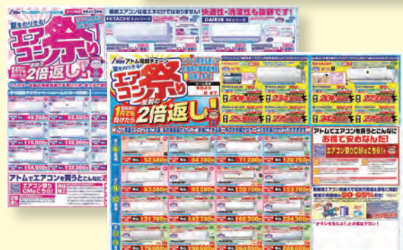
エアコン祭り各種チラシ24種類