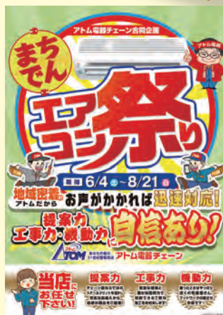
エアコン祭りサービス訴求ポスター