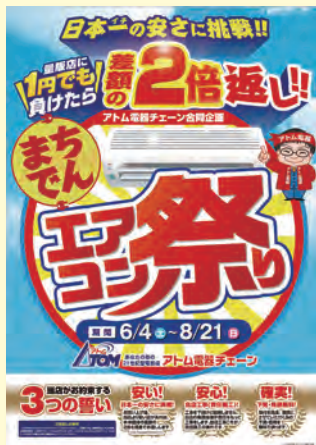
エアコン祭り価格訴求ポスター